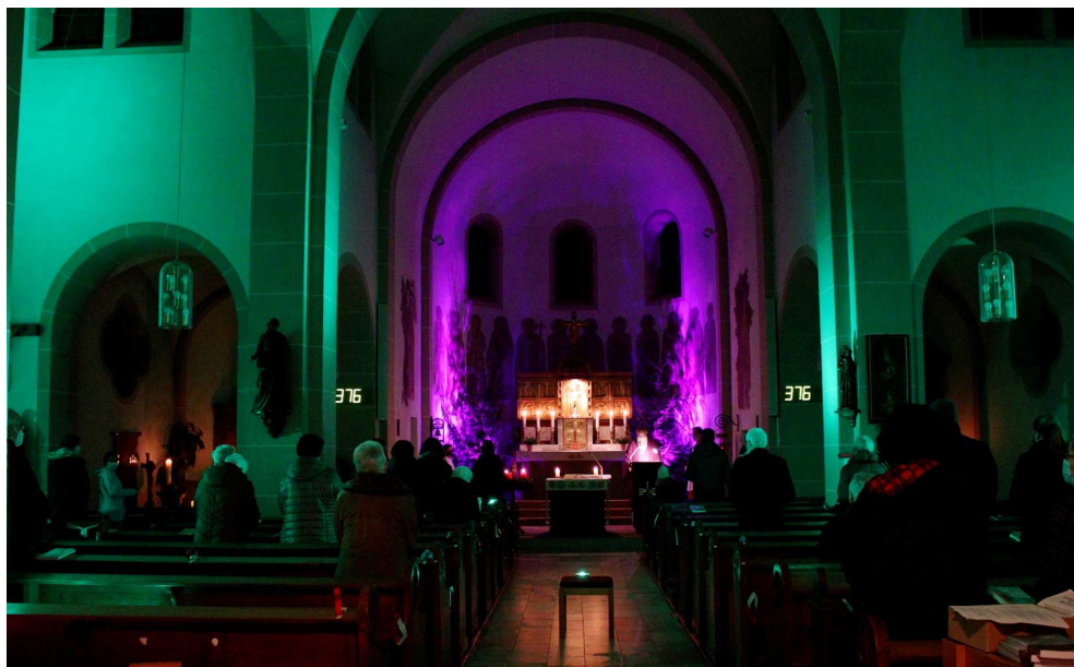
Foto der Kirche beim Gottesdienst von und mit Jugendlichen im Dezember 2020

Das Vorbereitungstreffen ist am Freitag, dem 30.4. um 19.00 Uhr im Willibrordushaus, sofern der Lockdown beendet ist, ansonsten findet es digital statt. Jede und jeder ist herzlich willkommen.