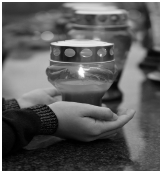
goranh_cc0-gemeinfrei, pixabay, pfarrbriefservice

aus Vussem aus Weiler a. B. aus Bergheim aus Mechernich, vormals Strempt aus Strempt aus Kallmuth aus Strempt aus Nöthen aus Mechernich aus Berg aus Mechernich aus Kalenberg aus Mechernich aus Strempt