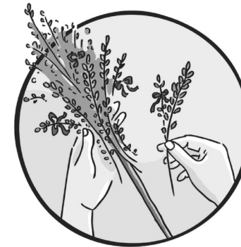
Palmstecken zu Palmsonntag

Für Palmsonntag werden Buchszweige benötigt. Wer etwas zur Verfügung stellen kann, meldet sich bitte im Pfarrbüro Mechernich unter 02443/8640.