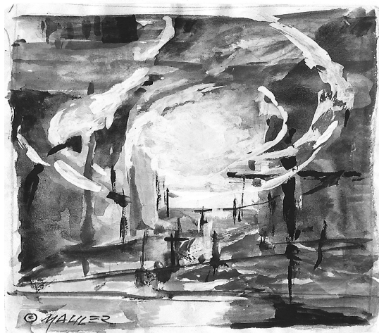
Die Gottesdienste zu Allerheiligen standen bei Redaktionsschluss noch nicht fest.

So. 30.10. 09.00 Uhr Eicks anschl. Gräbersegnung 09.15 Uhr Holzheim Hubertusmesse mit Bläserchor 09.15 Uhr Eiserfey mit Gräbersegnung 10.30 Uhr Bleibuir anschl. Gräbersegnung 10.45 Uhr Mechernich